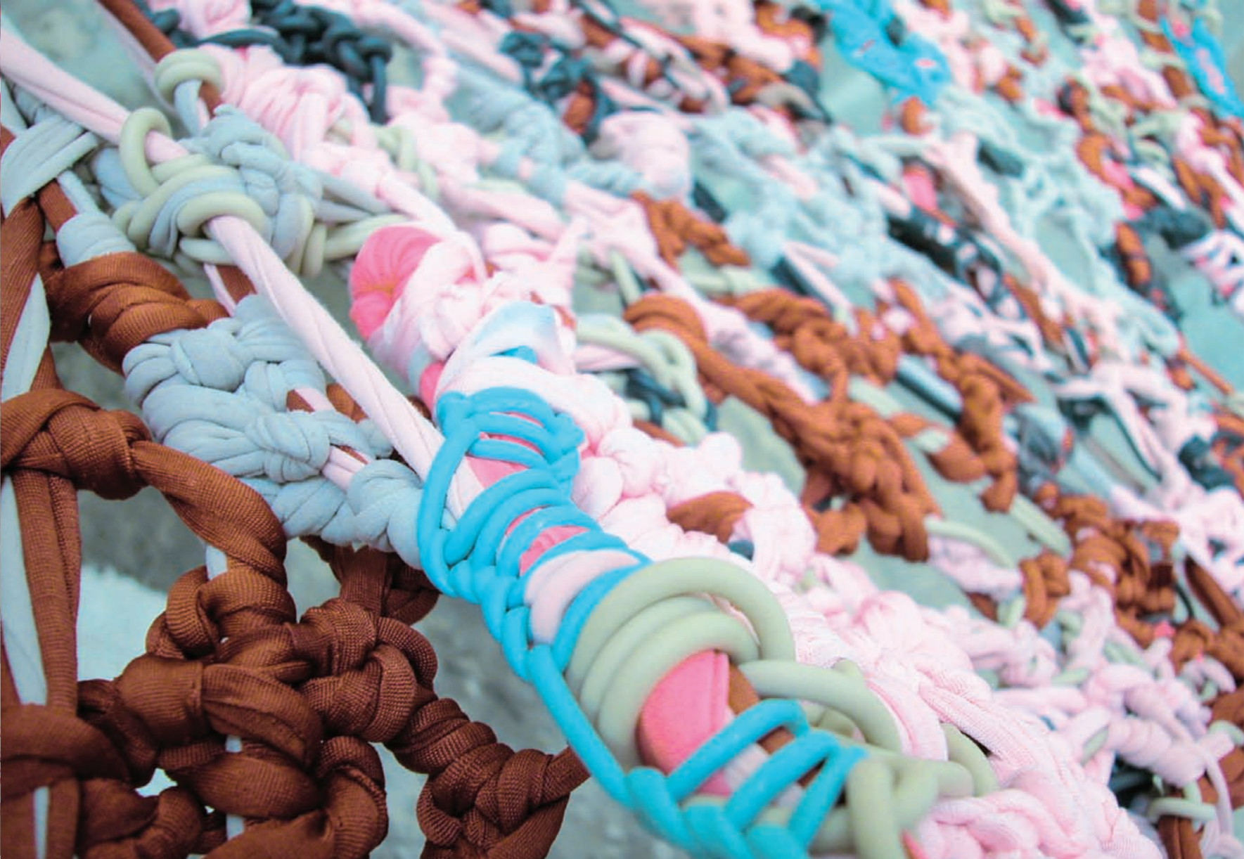
elastica_260 x 440 x 310 cm_bandes de latex, fils en nylon, élastomère, caoutchouc et plastique, mousquetons_2003